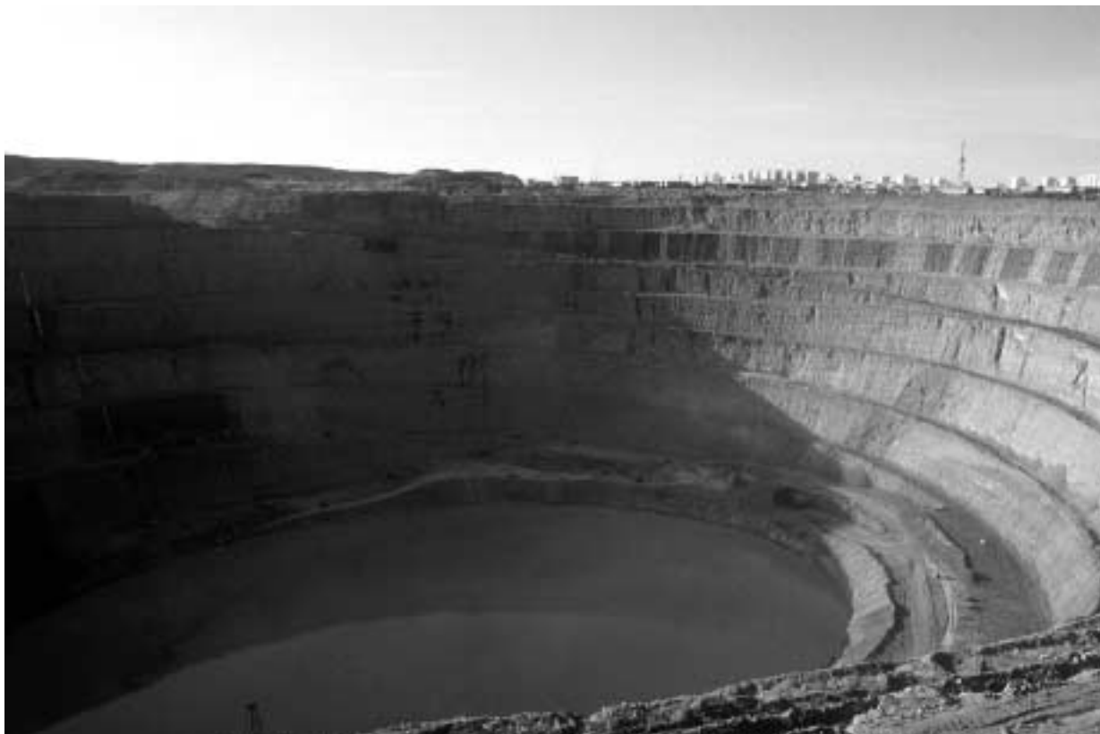
Рис.2: Алмазный рудник в Мирном

Вилюйские саха проживают в бассейне реки Вилюй на западе Республики Саха. Этот субарктический регион располагается между 62 и 64° с.ш. Ниже, на рис. 1, слева, показана Республика Саха в составе Российской Федерации, а справа – крупномасштабная карта Республики Саха с рекой Вилюй, районным центром Сунтар и двумя селениями, Элгээйи и Кутана, где проводилось исследование.