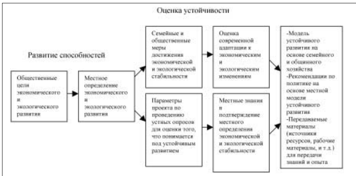
Рис.4: Схематическое представление исследовательского проекта