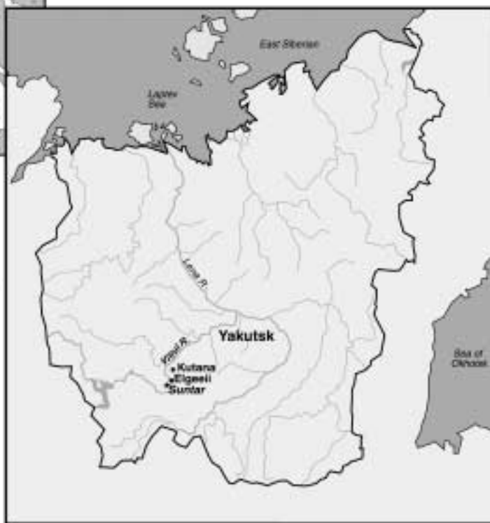
Рис. 1. Современная Республика Саха; сверху ее расположение в Российской Федерации; справа — местонахождение ее столицы Якутска и реки Вилюй с районным центром Сунтар и двумя селениями, Элгээйи и Кутана, где проводились исследования.