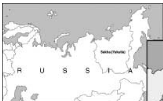
Figure 1: The contemporary Sakha Republic, above showing its location within the Russian Federation and to the right showing the location of the capital city, Yakutsk, the Viliui River, the Suntar regional center and the two research villages, Elgeeii and Kutana.

работы в селениях вилуйских саха на северо-востоке Сибири. В начале статьи содержится информация о вилуйских саха и месте проведения исследований, затем излагаются основные результаты исследований 1999-2000 гг., в завершение речь идет о текущем проекте работ.